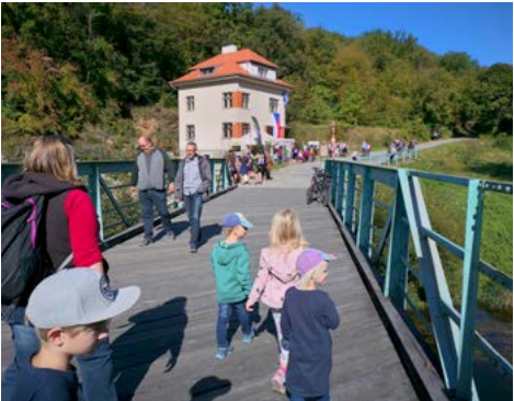
Grenzbrücke nach Tschechien