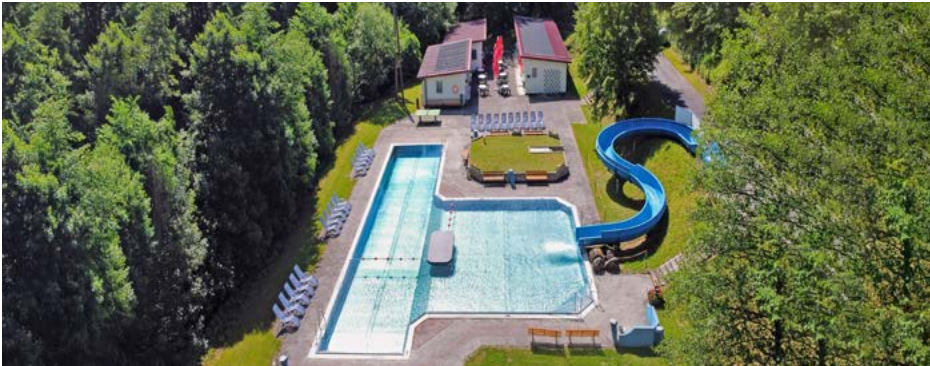
Idyllisch gelegenes Waldbad