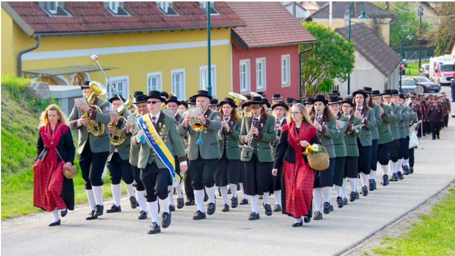
Waldviertler Grenzlandkapelle der Stadtgemeinde Hardegg