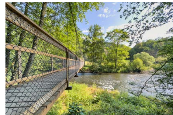
Hängebrücke bei der Einsiedlerwiese